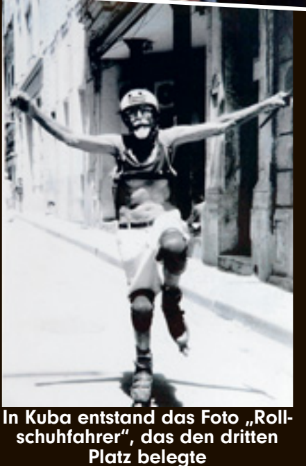
In Kuba entstand das Foto „Rollschuhfahrer“, das den dritten Platz belegte