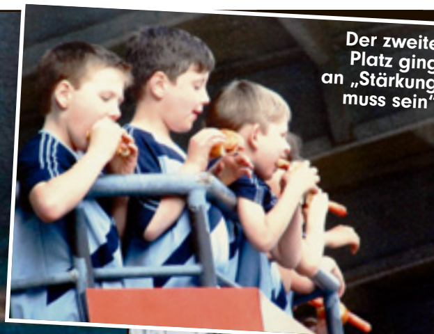
Der zweite Platz ging an „Stärkung muss sein“